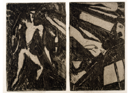
Ossip Zadkine, Album : eaux-fortes de la guerre 1914-1918

Aux côtés de ces dessins de guerre est présentée l'œuvre de Chris Marker (1921-2012), Owls at noon, Prelude : The Hollow Men , inspirée du poème Les Hommes creux écrit par T.S. Eliot en 1925. Fragments du poème de l'écrivain américain, photographies hallucinées de soldats blessés, images de femmes belles à pleurer, alternent de manière sérielle sur huit écrans, selon une écriture bouleversant les conventions narratives. Chambre d'écho, le temps d'une exposition, des éclats de guerre sur papier laissés par celui qui fut de ceux - Apollinaire, la tête bandée, Cendrars, le bras arraché – qui en revinrent. Dont le destin fut d'en revenir.